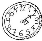
las tres y diez