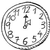
la una en punto

De Madrid a Toledo hay ochenta kilómetros.