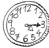
las cuatro y cuarto